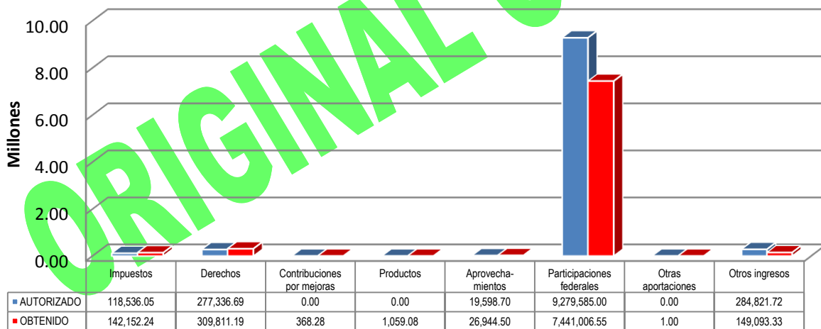
GRÁFICA 1 INGRESOS

Otros ingresos: Aportaciones de Bursatilización $149,093.33.